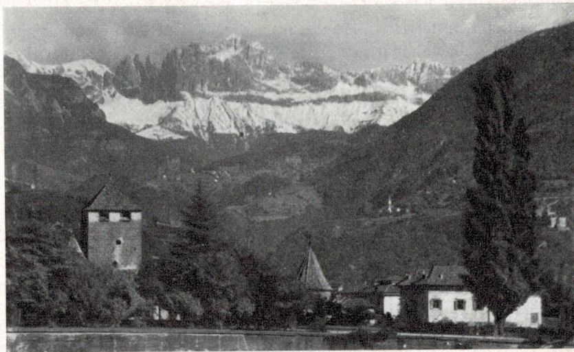
Das ist die Landschaft von Bozen-Gries: ein blühender Garten und Rebenland und Almenreich und im Hintergrund die Zacken und Türme des sagenumwobenen Rosengarten, wo König Laurin seine Schätze verborgen hält.

Ringsum erheben sich die Berge in reicher Abwechslung. Das landschaftliche Glanzstück von Bozen ist der sagenumwobene Ro-